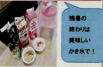
残暑の 終わりは 美味しい かき氷で!