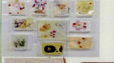
ものづくりでは、 アレンジマグネットを 制作しました。 シールやお花を入れ、 世界に1つの作品に なりました★