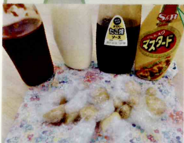
園芸にて★ 今期最後のじゃがいも達です★ 色んな調味料で食べました。 成長を見届けたホクホクのお芋達... とても美味しかったです。