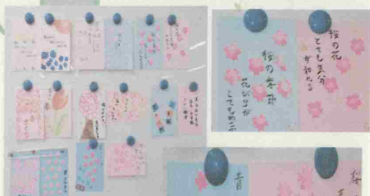
アートにて☆ 春らしい色の 画用紙に、春らしい スタンプのお花が 綺麗ですね☆