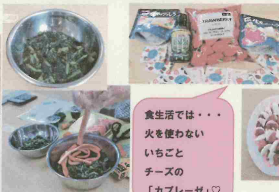
食生活では・・・ 火を使わない いちごと チーズの 「カプレーゼ」♡