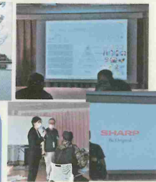
なんと!あのSHARPから お客様をお呼びして障害者 雇用、特例子会社について 講演していただきました。 とても勉強になりました☆