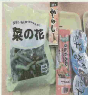
栄養士さんをお呼びして 春の食材「菜の花」で2品、 調理していただきました☆ からし和えともずく和え、 とても美味しかったです♪