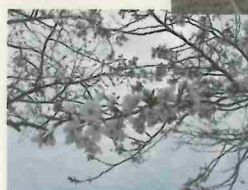
お花見☆ 満開で綺麗な 桜の木の下を ゆっくり 歩きました♡